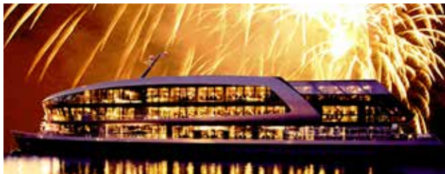
reproduziertes Bild