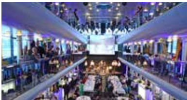
© Ann Katrin Plangger, Wolfgang Oberschelp